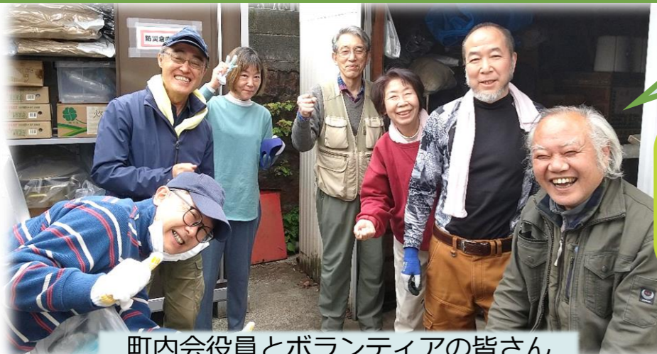
町内会役員とボランティアの皆さん