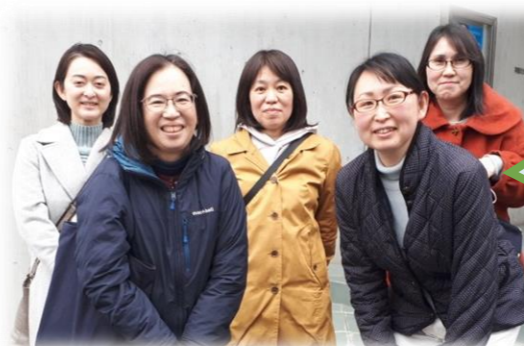
新子ども会役員の皆さん