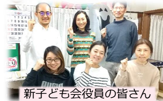
新子ども会役員の写真

2022年度の子ども会役員です!! 新1年生 & 新2~6年生の皆さん、入学&進級おめでとうございます! 1年間宜しくお願いします。