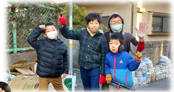
廃品回収を手伝って下さる皆さん

従来、廃品を集積場所まで運ぶことが困難な方にはご自宅前の道端に置いてもらいました。ある地区では、 子ども会や地域の皆様 に道端に置かれた 廃品 を集積場所まで運んで頂いています。一方で、子ども会の少ない地区では、子ども会役員が一人で何往復もして運んでいます…。子ども会役員は小さなお子さんがいたり仕事を持ったりするので、朝の忙しい時間に小さくはない負担です…。