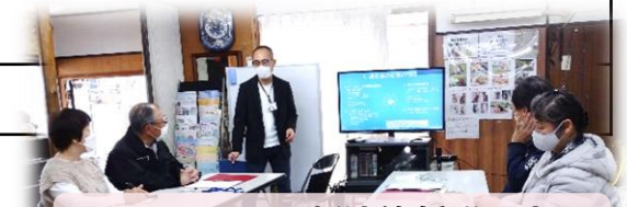
3/17(土)の新連絡係説明会