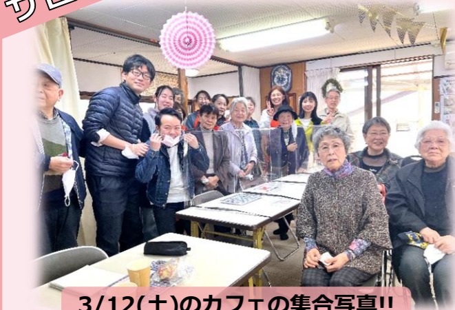
3/12(土)のカフェの集合写真!!