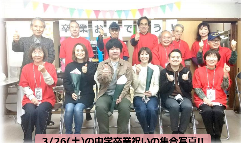
3/26(土)の中学卒業祝いの集合写真!!

多くの世代に地域と接点を持つ機会をとの願いを込めて、記念すべき第1回目の中学卒業祝い!! (申し込み4件) 中学時代の楽しい思い出話や4月からの新しい生活の話などに花が咲き、笑いの絶えない交流会になりました。新しい生活へ不安や期待があるかもしれませんが、齋南町内会は、皆さんの大きな成長を応援しています!