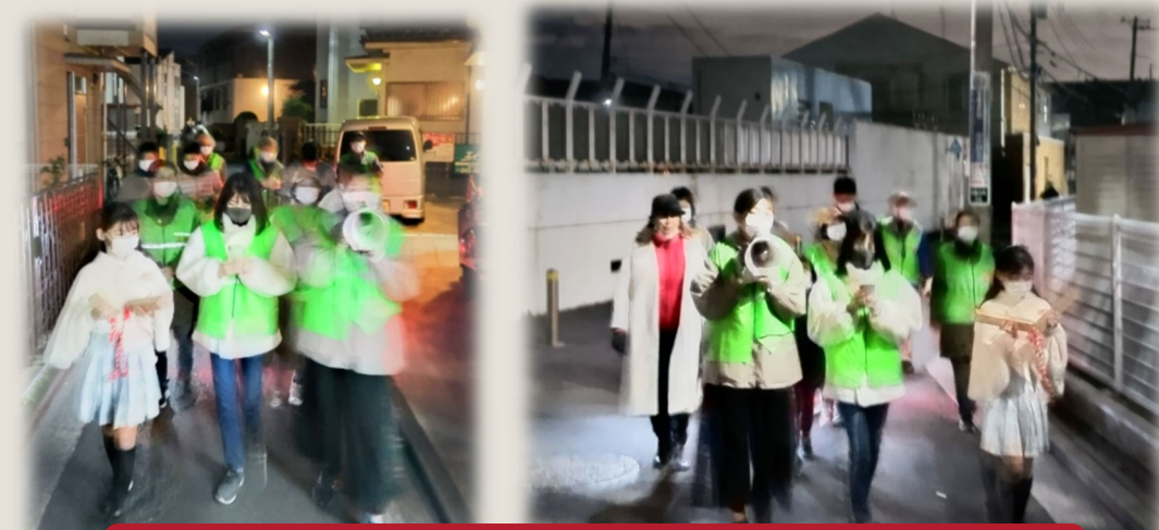
中学生・小学生が先頭に立って元気な掛け声でパトロール!!

毎年恒例の年末防犯パトロールを行いました。寒い中にも関わらず、子どもたちの音頭で、齋南町内を一時間程度元気にパトロールしました!!