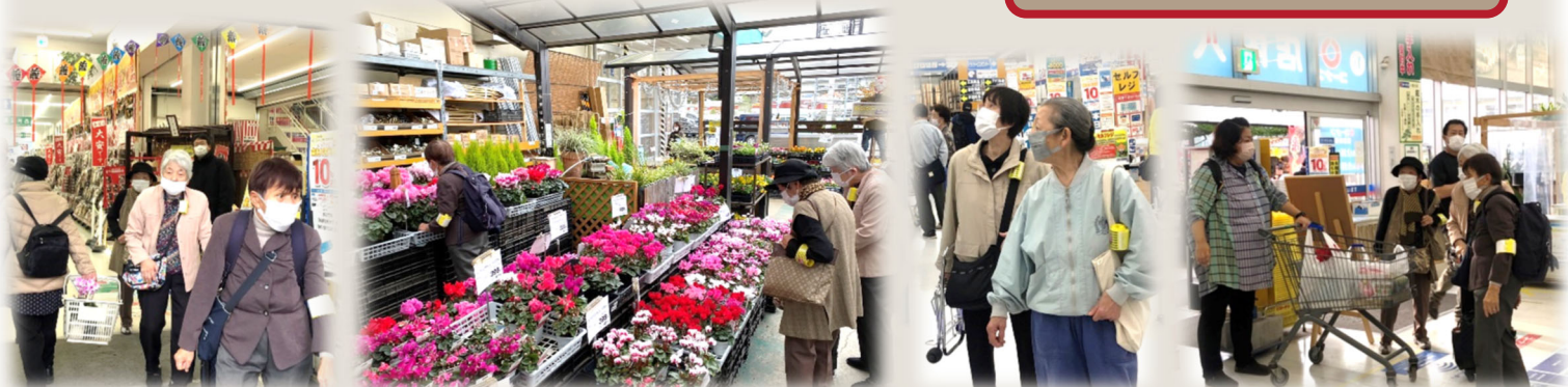
園芸品や日用品などが沢山あり、見ているだけでもワクワクです!! お花もキレイですね!