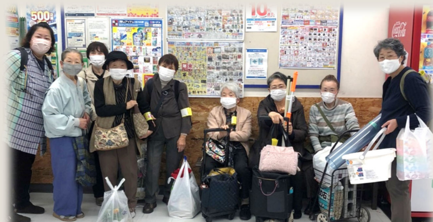
コーナン(保土ヶ谷星川)で沢山買い物してきました!!