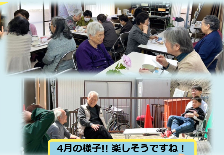
4月の様子!! 楽しそうですね!