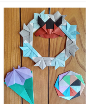
『五角形のくす玉と台』『兜のリース・花菖蒲・コースター』です!! (4月の作品より)