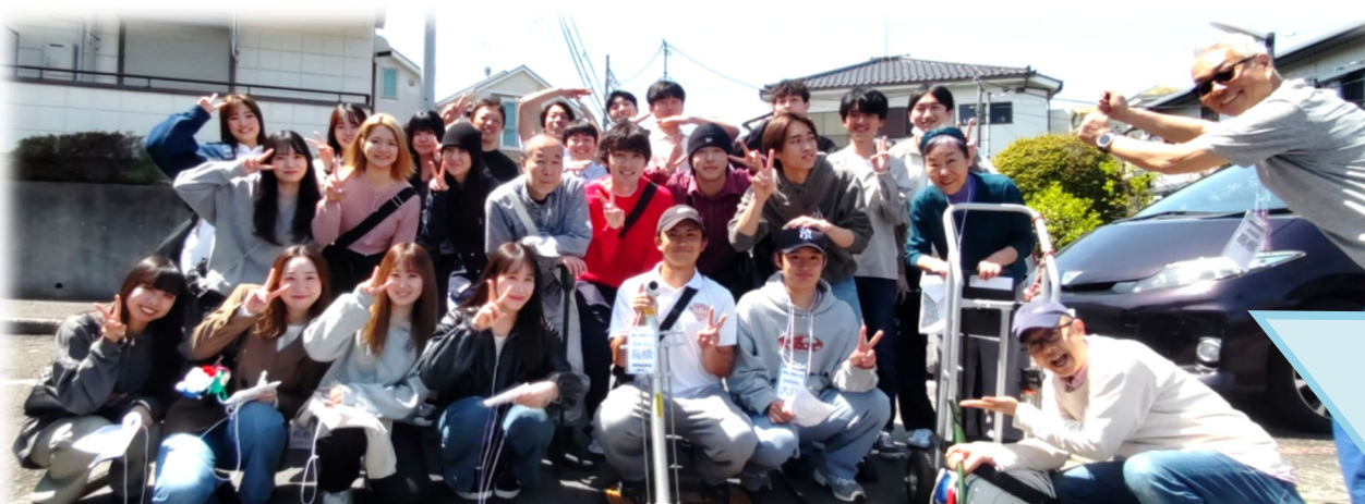
4/14(日)に神大・寺嶋ゼミの学生と合同の防災イベントに向けて打合せを行いました!!