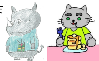
齋南公式キャラクター